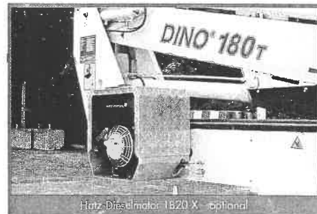
Hatz-Dieselmotor 1820 X optional